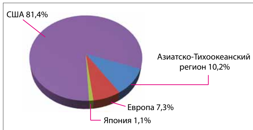
Рис. 1. Доли производственных мощностей по выпуску пластин в США компаний с американской (штаб-квартира в США) и зарубежной пропиской

данством, а на долю американских заводов, принадлежащих странам Азиатско-Тихоокеанского региона и Европы, приходилось соответственно 10,2% и 7,3% (см. рис. 1) [1]. В глобальном мировом масштабе 44,3% всех производственных мощностей по производству пластин у компаний с американской пропиской размещены в США, в Сингапуре – 17,4%, в Европе – 9,9%, Японии – 8,15%, а в Китае – всего 5,1% (см. рис. 2) [1]. В 2018 г. американские полупроводниковые компании также занимали в среднем 45% мирового полупроводникового рынка, что составляет самую большую часть этого рынка любых стран (см. рис. 3) [1]. Однако за последние 5–7 лет четко сформировалась тенденция потери американцами лидерства в наиболее важной сфере полупроводниковой микроэлектроники – технологии и производстве кристаллов с проектными нормами менее 10 нм. Задававшая много лет технологическую